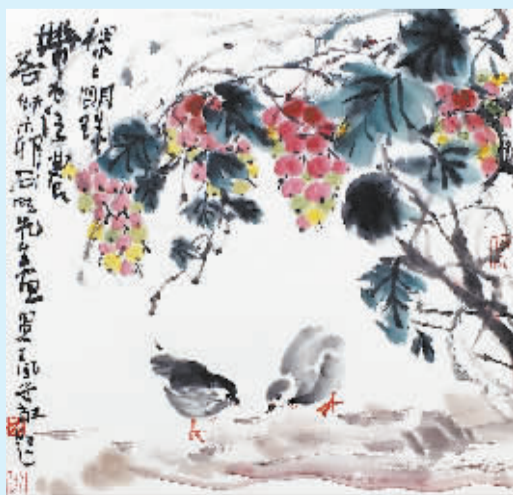
柳石明作品《颗颗明珠》