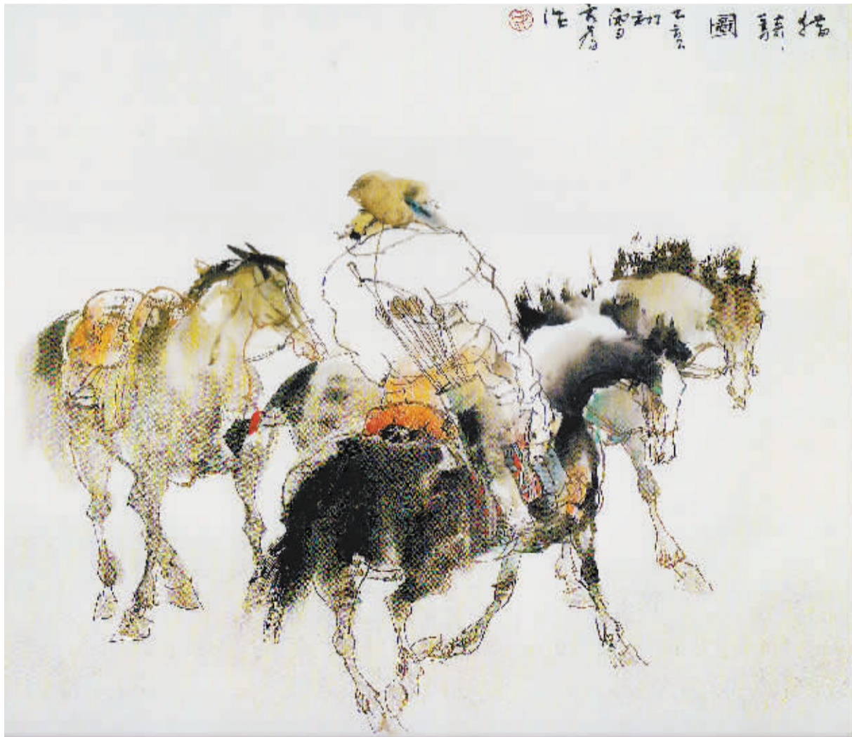
刘大为作品《猎骑图》