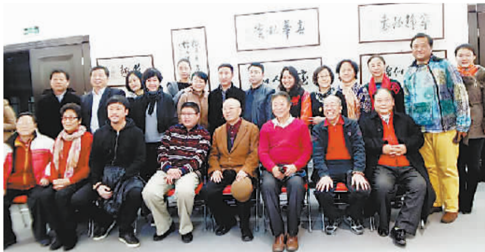
展览现场嘉宾合影

日前,由燕京书画社、中国五老公益工程组委会共同举办的“丹青诗意、笔墨精神——谢芳、雷恪生、于淑珍、柳石明、卢奇书画联展”在燕京书画社开幕。此次,五位艺术家联袂办展,是在表演艺术之外的首次跨界合作。李光羲、王铁成、赵葆秀、李牧、齐世龙、曹灿、韩芝萍、黄越峰、庞好等艺术家出席开幕式。参展的五位艺术家中,谢芳、雷恪生、卢奇是著名的表演艺术家,于淑珍、柳石明为歌剧表演艺术家,他们在钻研表演艺术之余寄情书画,每一幅作品都是至真性情的表达。