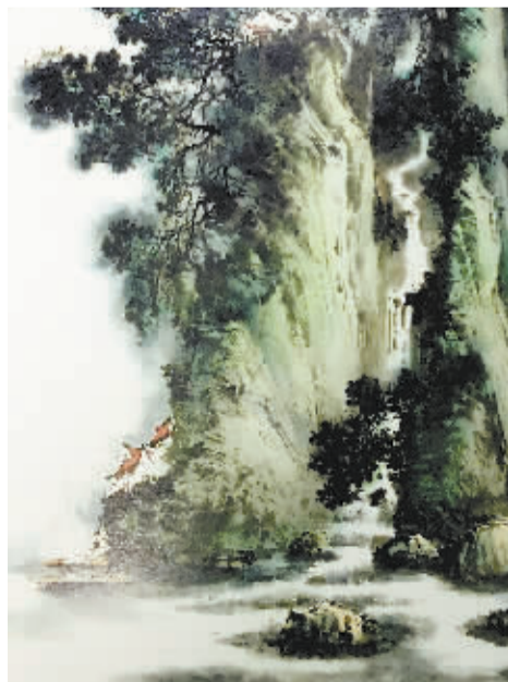
王振作品《江南水景》(局部)