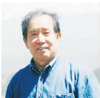
著名山水画家李春海

李春海之所以花大量的精力研究古诗词,创作诗意画,是因为古诗词是中华民族精英文化的宝库,其中不但内涵有优美、深邃的艺术意境,而且最能体现语言组合方式、艺术思维方式和艺术表达方式的特征,特别是民族文化精神的本质特征。我国古典诗歌表达方式的表演性、写意性与山水画的表演性、写意性相通。学习借鉴古典诗词,不但可以提高文化素养,而且可