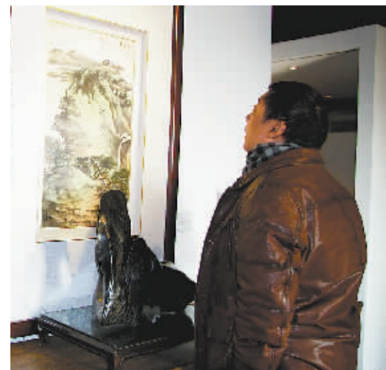
位于宋庄的元亨利艺术馆展出的古典家具在传统书画的映衬下,显得更具格调。